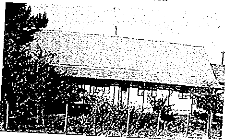
Die woning van Johan Cloete op die plaas Uitkyk

Ons sal dit later in 'n bylaag invoeg, en ook enkele foto's daarin reproduseer - weliswaar net in swart-en-wit.